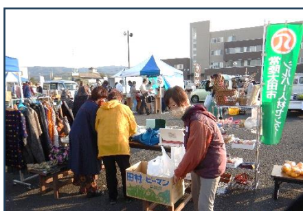
手工芸品・農産物を朝市で販売