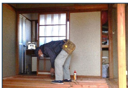
床の補修作業の様子