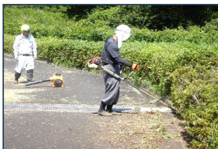
草刈り作業の様子