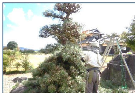
庭の植木剪定作業の様子