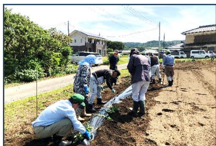
サツマイモ苗植付の様子