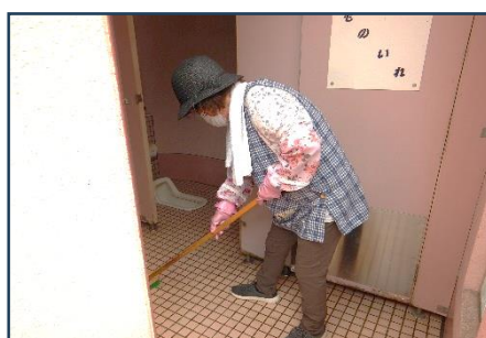
公園内トイレ清掃の様子