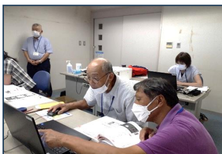
パソコン教室指導の様子