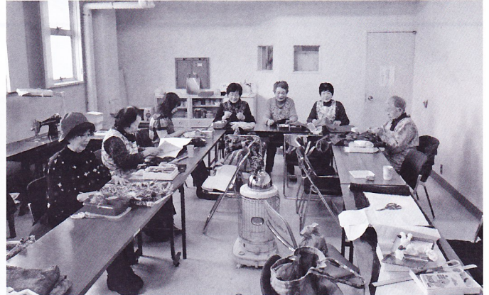
女性会員による手芸品の製作