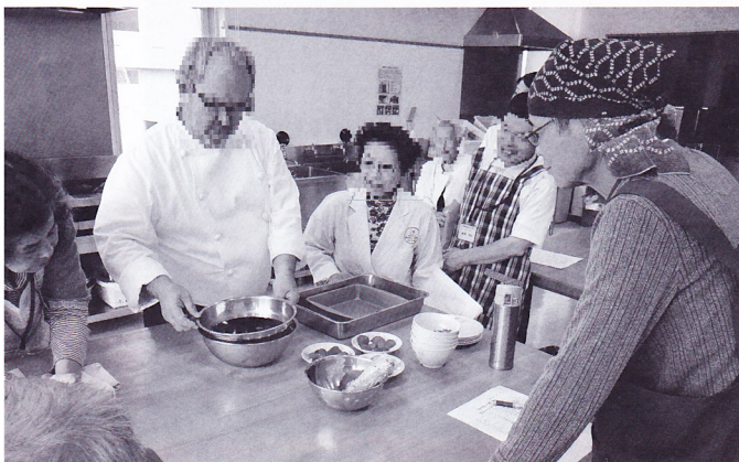
店舗調理補助スタッフ講習（那珂市）受講