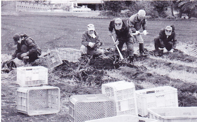
サツマイモの収穫作業