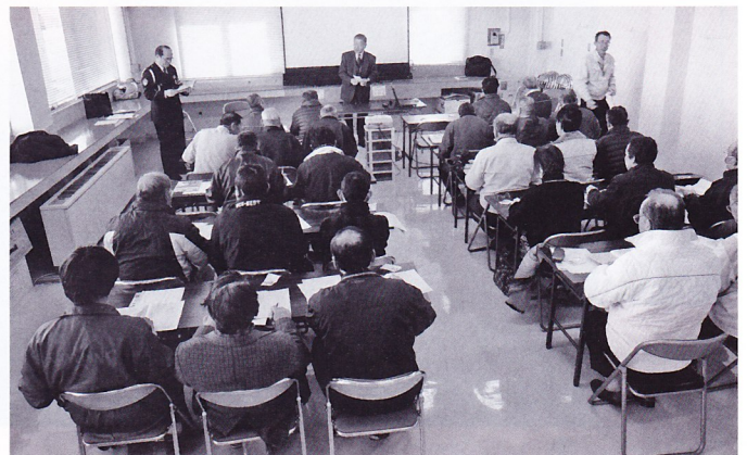
安全運転講習会（センター会議室）