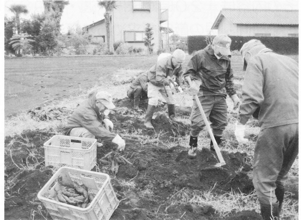
サツマイモの収穫