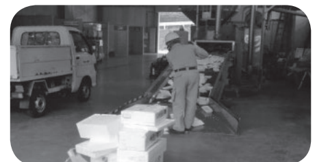
清掃センターでの派遣就業