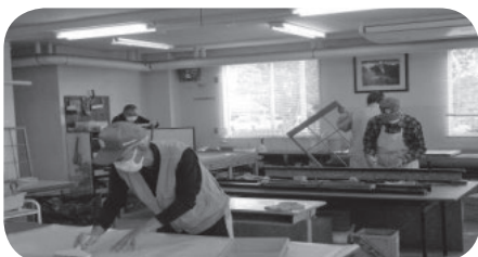
襖・障子張替え作業