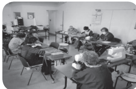
独自事業：手芸品製作