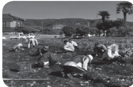
独自事業：さつまいもの収穫